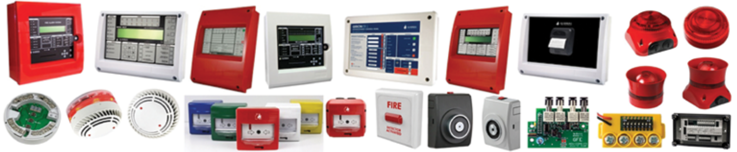
CONVENTIONAL & ADDRESSABLE FIRE ALARM EQUIPMENT