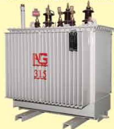
315 kVA, 11/0.4 kV, NLTC -7 Tap (Aluminium winding Type)