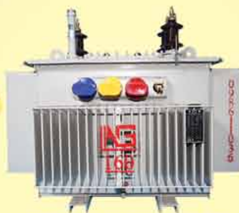
160 kVA, 11/0.4 kV, NLTC -7 Pad Mounted Transformer