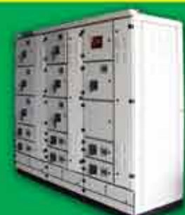
Main Distribution Board

Yangon Address - No. 501/503, Pyay Road, Kamaryut Township, Yangon, Myanmar.