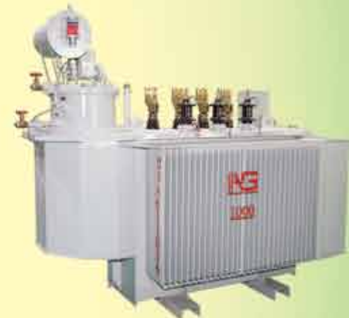
1000 kVA, 11-6.6/0.4 kV, OLTC - 9

Asia General Electric Co.,ltd manufacture Medium & Low voltage Switchgear with both Mitsubishi (Japan) and ABB (Italy) Technologies.