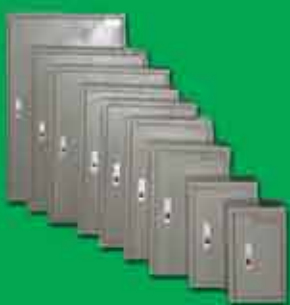
CE & QE Panel

Asia General Electric Co.,ltd manufacture Medium & Low voltage Switchgear with both Mitsubishi (Japan) and ABB (Italy) Technologies.