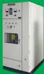
11kV Load Break Switch Panel