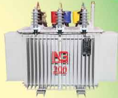
200 kVA, 11/0.4 kV, NLTC -7 Pole Mounted Transformer