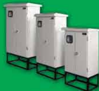
kWh Meter Panel