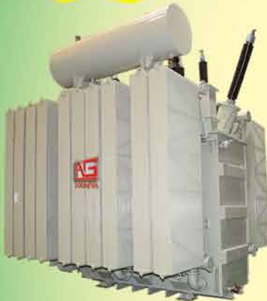
(100MVA, 230/66/11 kV) Power Transformer