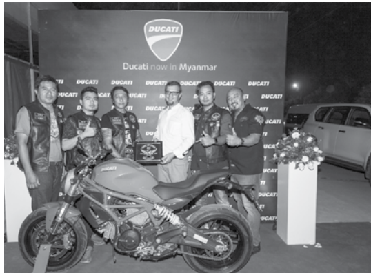
ငွေပေးချေမှုစနစ်ဖြင့် ဝယ်ယူနိုင်မည်ဖြစ်ကြောင်း သိရသည်။

ယခု အရောင်းပြခန်းနှင့် ဝန်ဆောင်မှုစင်တာ ဖွင့်လှစ်လိုက်ခြင်းကြောင့် Ducati ၏ အထင်ကရ နာမည်ကြီး မော်ဒယ်များဖြစ်သည့် Monster၊ Panigale V4 နှင့် Ducati Scrambler များကိုလည်း ပြည်တွင်းတွင် အရစ်ကျ